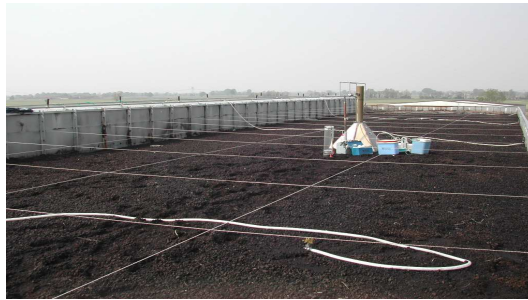
Figura 1. Campionamenti su un biofiltro

Successivamente, attraverso l'analisi statistica delle regressioni, abbiamo cercato di correlare i parametri fisici all'efficienza di abbattimento dell'odore misurata, in modo da fornire uno "strumento gestionale" di facile utilizzo.